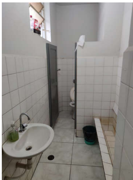
Figura 4. Acesso ao banheiro com porta estreita, não possibilitando o acesso de cadeirantes.