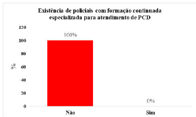
Figura 7. Existência de policiais com formação continuada especializada para atendimento de PCD

A Figura 7 apresenta os dados relativos à existência de policiais com formação continuada especializada para atendimento de PCD. Os resultados revelam que nenhum dos policiais lotados na DRPC apresentam capacitação continuada para atendimento de PCD, o que implica em grande desafio na prestação de serviços da Polícia Civil para esses indivíduos.