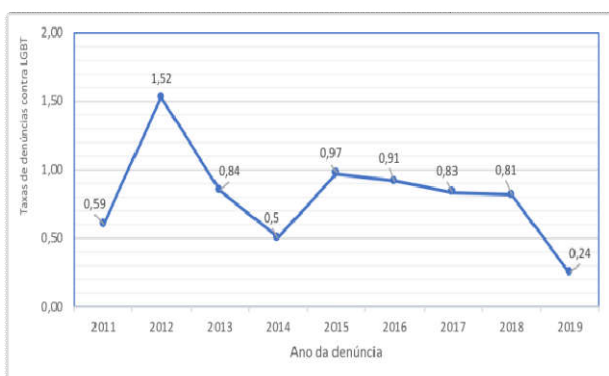
Gráfico II. Taxa de denúncias contra LGBTQIA+ no Disque 100 (2019) por ano