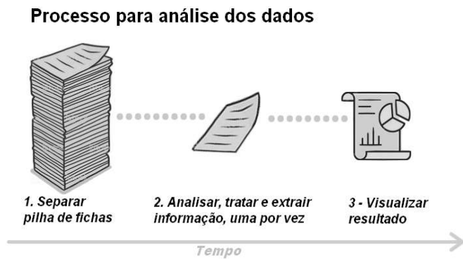
Figure 1. Processo para análise dos dados

A automatização do preenchimento das fichas de atendimento, somada à solução de BI, permite que o processo de análise dos dados seja mais eficiente, pois o aplicativo desenvolvido permite que as fichas individuais sejam acessadas rapidamente e que os relatórios estatísticos estejam sempre atualizados em tempo real. Para validar e verificar o MVP, desenvolveu-se um gerador de dados aleatórios, para poplar o banco de dados com informações fictícias. Dessa forma, todo ou qualquer dado apresentado pelo MVP, não apresenta nenhum cenário ou condição real de atendimento. Por se tratar de uma aplicação que pretende substituir o preenchimento manual em papel utilizando dispositivo mobile, a visualização da ficha preenchida é por meio de um navegador web através de uma url gerada após a conclusão do preenchimento, controlada e mantida pelo Back-end. A aplicação foi projetada para permitir o compartilhamento da url da ficha utilizando-se por meio de SMS e E-mail via serviço disponível na API, além de garantir o download em formato PDF, para a impressão.